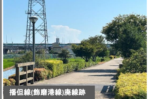
播但線(飾磨港線)廃線跡

2024年 10月27日(日) 受付/出発 9:30~10:00 地図を受取った方から、さあスタート! 小雨決行