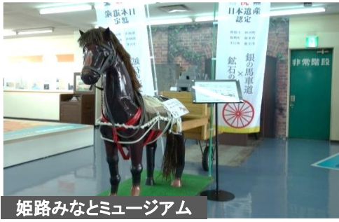
姫路みなとミュージアム